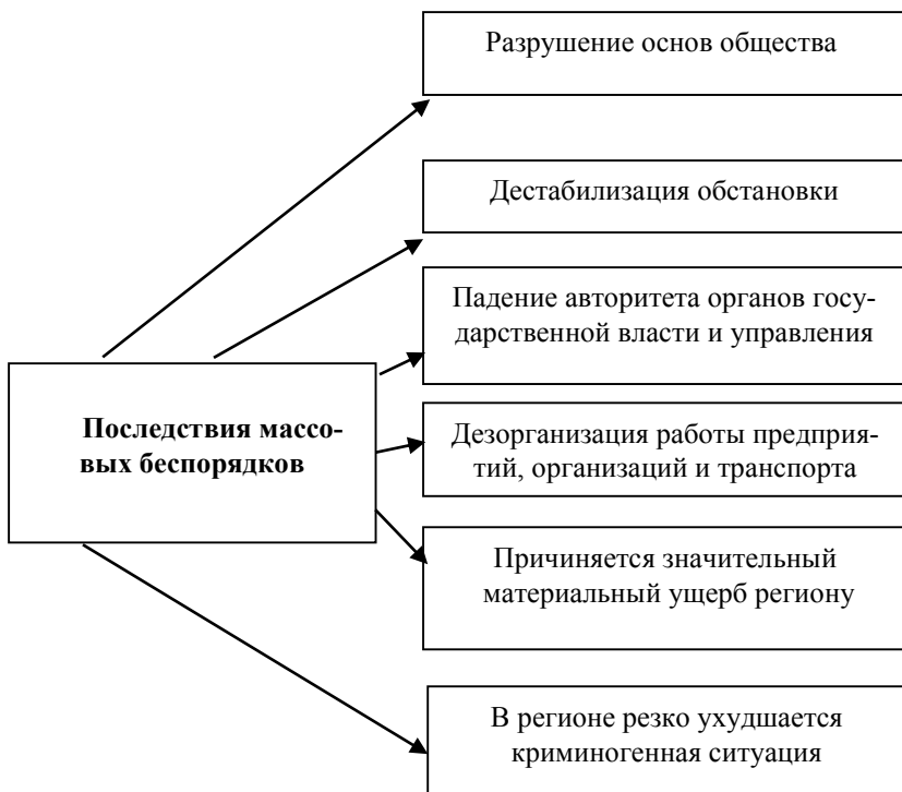
Рисунок 2 — Последствия массовых беспорядков

К незаконным массовым мероприятиям относятся также: