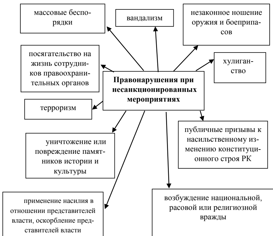
Рисунок 3 — Нарушения при несанкционированных мероприятиях

При обеспечении безопасности и порядка задача сотрудников ОВД состоит в следующем: