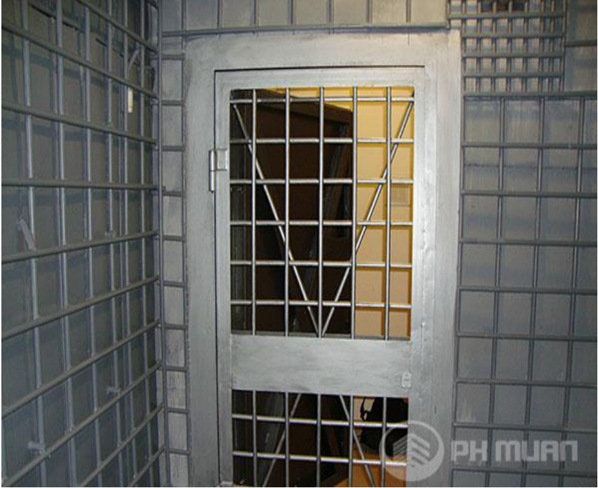
комната хранения огнестрельного оружия (рис 13)

По результатам проверки объектов составляется акт, в котором перечисляются выявленные недостатки, указываются сроки их устранения. Если при проверке будет установлено, что имеющиеся условия не обеспечивают сохранность оружия (отсутствие второй металлической двери-решетки в комнате хранения оружия, отсутствие решеток на окнах, слабые ли упрощенные запоры на дверях, шкафах, не требующие больших усилий для вскрытия, хранения оружия в деревянных, обитых железом шкафах, слабые филенчатые входные двери, отсутствие охранной сигнализации, совместное хранение оружия с хозяйственным имуществом), оно должно быть немедленно изъято и возвращено организации только после устранения всех выявленных недостатков и создания необходимых условий для хранения. [10].