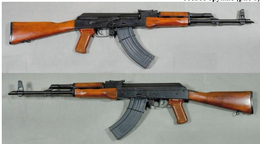
боевое оружие (рис 1)

1) боевое ручное стрелковое и холодное оружие. (рис 1,2)