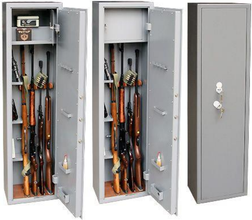
металлические сейфы (рис 9)

В ходе проверки объектов с хранением и использованием служебного оружия (в том числе субъектов охранной деятельности) обратить особое внимание на: (рис 10,11)